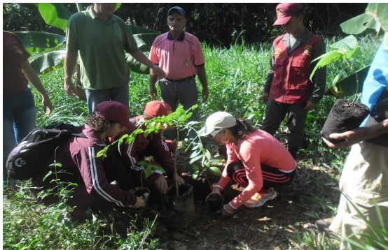
Relator de noticia: Lcda. Liliana Neira