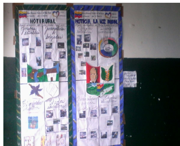
Redactor de noticia: Msc. Liliana Neira.