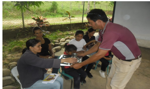
Relator de noticia: Lcda. Liliana Neira