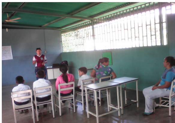
Redactor de Noticia: Msc. Liliana Neira.