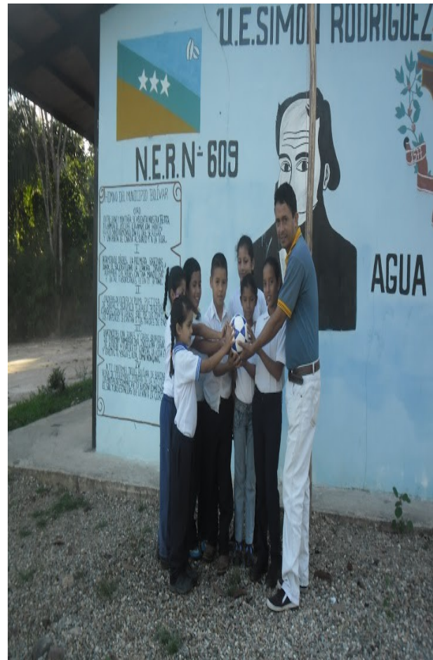
Redactor de Noticia: Lcda. Liliana Neira.

De igual manera, este material será utilizado por todos los niños y niñas pertenecientes a esta institución.