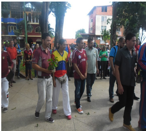
Redactor de Noticia: Lcda Liliana Neira.